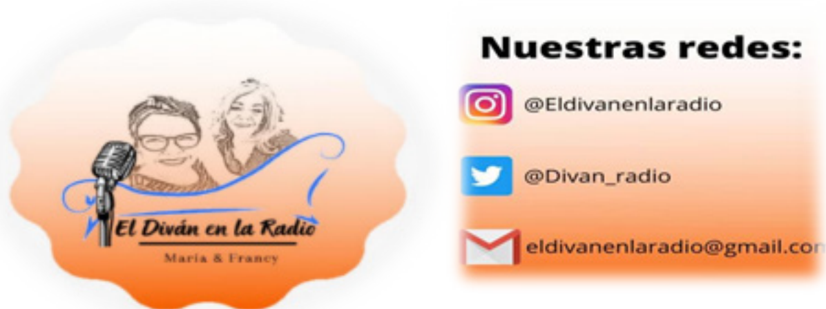
Imagen corporativa y redes sociales del programa radial El Diván de la Radio.