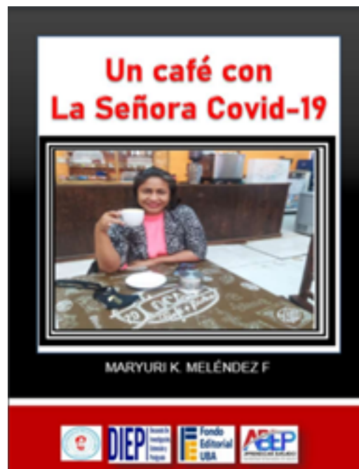
Imagen de la portada del libro Un café con la señora COVID-19.

Nota. Adaptado de Un café con la Señora COVID-19, M. Melendez, 2022, https://es.calameo.com/books/0043474573636daa93be9