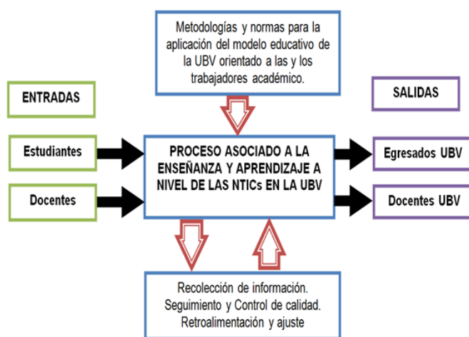
Figura 2. Modelo del proceso a implementar a la enseñanza y aprendizaje a nivel de las NTICs.

La principal diferencia entre el proceso actual y el que se pretende implementar está asociado a la necesidad de dar respuesta al desarrollo actual de la universidad en su crecimiento hacia la calidad educativa, no obstante existe la tendencia a retardar los procesos de perfeccionamiento profesional, y es desde este punto que se