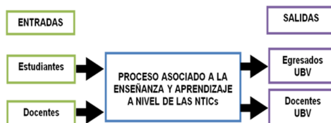
Figura 1. Modelo actual del proceso asociado a la enseñanza y aprendizaje a nivel de las NTICs.

A continuación se presentan el modelo actual del proceso asociado a la enseñanza y aprendizaje a nivel de las NTICs de la UBV y el modelo del proceso a implementar a la enseñanza y aprendizaje a nivel de las NTICs, ver figuras 1 y 2 respectivamente: